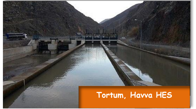
Tortum, Havva HES

Yenilenebilir enerji sektöründe faaliyet göstermek ve benzeri alanlarda yatırımlarda bulunmak amacıyla kurulmuştur. Faaliyet konusu yenilenebilir enerji kaynaklarını kullanan enerji santrali yatırımları ile elektrik enerjisi üretmek ve bu üretilen elektriği elektrik şebekesine, dağıtıcı firmalara veya tüketicilere satmaktır.