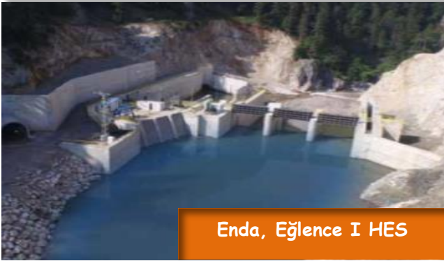
Enda, Eğlence I HES